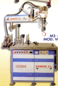
○ M3 - M130 MOD. VITORIA

PER ULTERIORI INFORMAZIONI / WEITERE INFORMATION BEI PARA MAIS INFORMAÇÃO