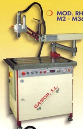
○ MOD. RHG-2B M2 - M36