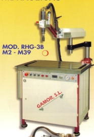
MOD. RHG-3B M2 - M39 ○