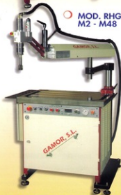
○ MOD. RHG-3BR M2 - M48